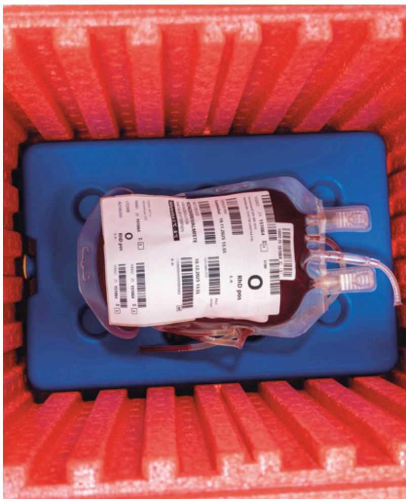
Kokoverivalmiste kuljetuslaatikossa.

Kokoverivalmisteseen liittyviin kysymyksiin vastaa asiakaspalvelu@veripalvelu.fi. Lisätietoja löytyy myös Verivalmisteiden käytön oppaasta. ■