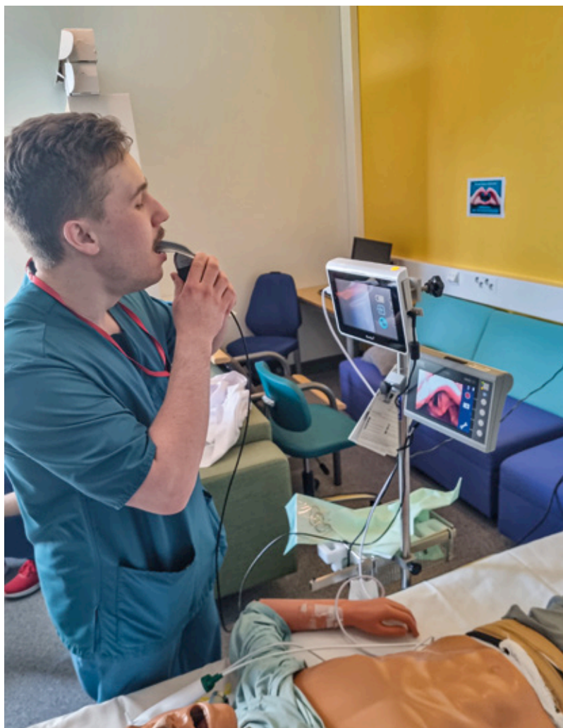
Potilaiden puutteessa voi tarvittaessa intuboida myös itsensä.

tumisen alkuvaiheessa toteutetaan helpompia anestasioita yhdessä seniorilääkärin kanssa perustaitoja harjoitellen. Klinikassamme käden-taidot esimerkiksi puudutuksissa ja kanyloinneissa kehittyvät nopeasti.