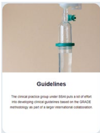
CPC:n ensisijainen tehtävä on ohjeistusten luominen ja vahvistaminen