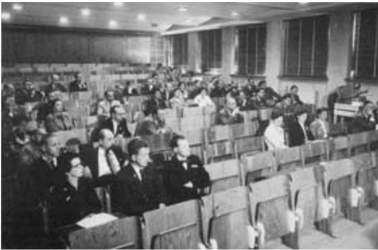
Pohjoismaisen Anestesiologiyhdistyksen neljännen kongressin osallistujia Kauppakorkeakoulussa Helsingissä.